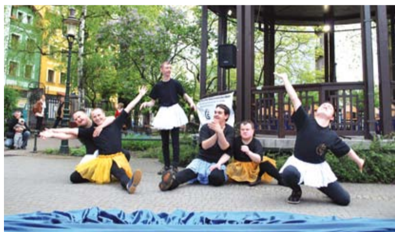
Występ grupy tanecznej

obecności w społeczeństwie, ale także – a może przede wszystkim – dlatego, że w każdym niepełnosprawnym człowieku tkwi Wilde'owska „prawdziwa doskonałość”, przejawiająca się nie w tym, co ów człowiek posiada, lecz w tym, kim jest.