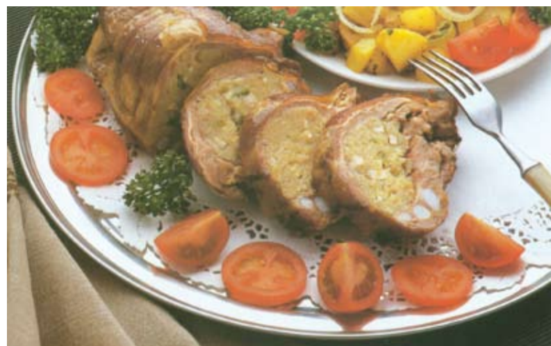
Nadziewany mostek cielęcy