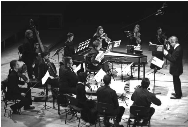
Orkiestra Arte dei Suonatori, fot. z archiwum organizatorów

Kolejnym wydarzeniem będzie Festiwal „Muzyka Dawna w Cieszynie”. Festiwal to tryptyk koncertowy, który odbędzie się w dniach 11, 12, 13 czerwca.