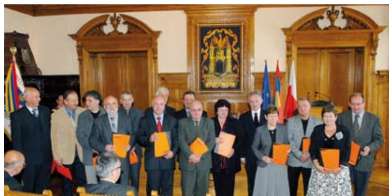
Radni I kadencji Rady Miejskiej Cieszyna