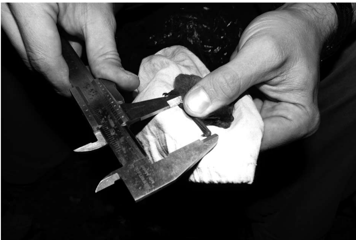
Pomiar długości przedramienia nietoperza

Zapraszamy Czytelników do współredagowania tej kolumny. Prosimy o nadsyłanie ciekawostek związanych z Cieszynem (np. anegdot, przepisów kulinarnych, zdjęć, dokumentów, wzorów rękodzieła artystycznego itp.), które mogłyby zainteresować innych i wzbogacić wiedzę o naszym mieście. Gwarantujemy zwrot wszystkich otrzymanych materiałów.